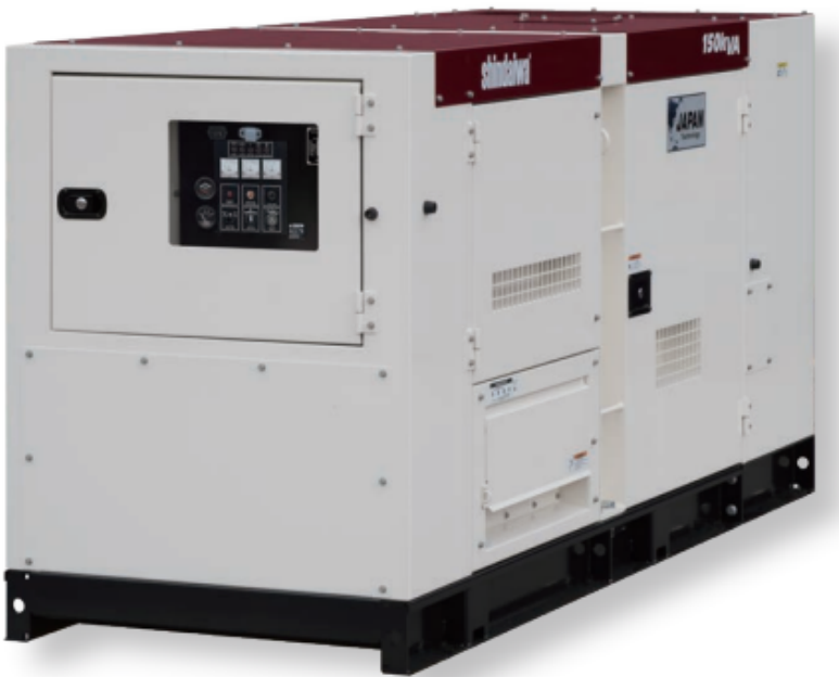
Andamios maquinaria y accesorios para cimbra